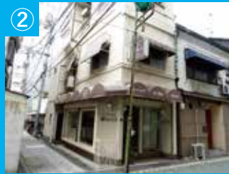
② グリーンロード沿いの旧店舗