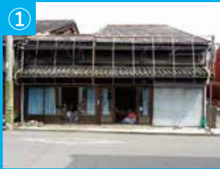
① 本町通り沿いの古民家