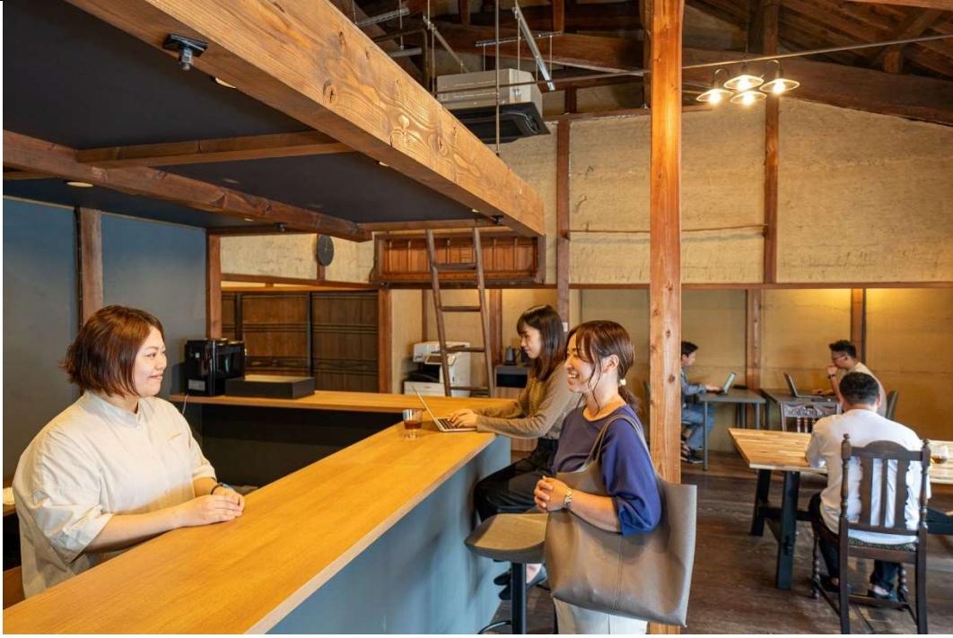
2階メインカウンター