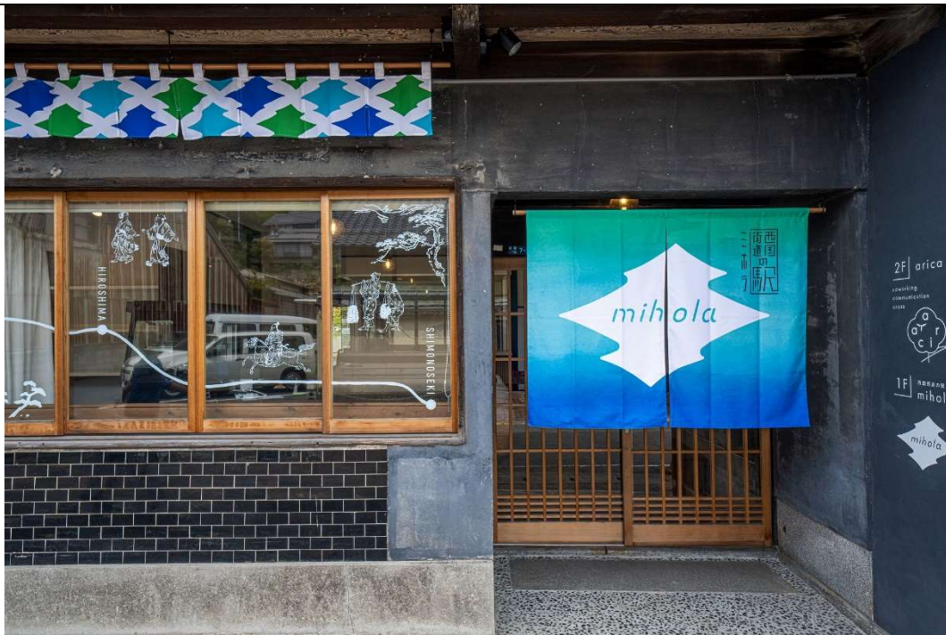
メインエントランス