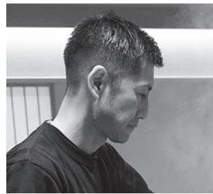
塩そばまえた 代表