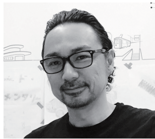
株式会社スード・エレメンタリー 代表取締役